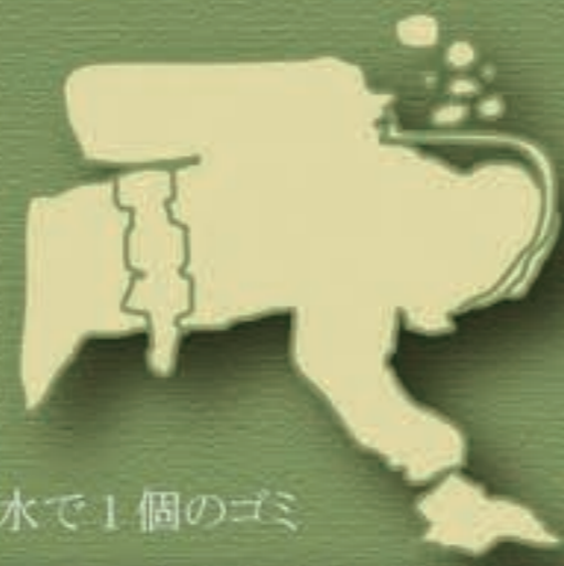
1回の潜水で1個のゴミ

グummyジョブ！ ↓ 店へ持帰り計量 ↓ ゲットナンバー決定 ↓ ゴミの種類や重量などを記入